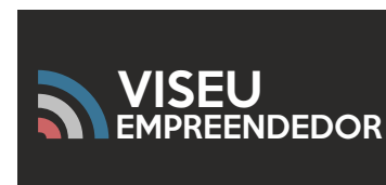
A Preto e Branco Positivo / Negativo